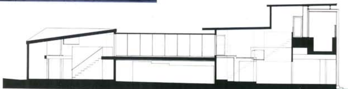
sezione longitudinale/longitudinal section

progetto/project Scogin Elam and Bray Architects