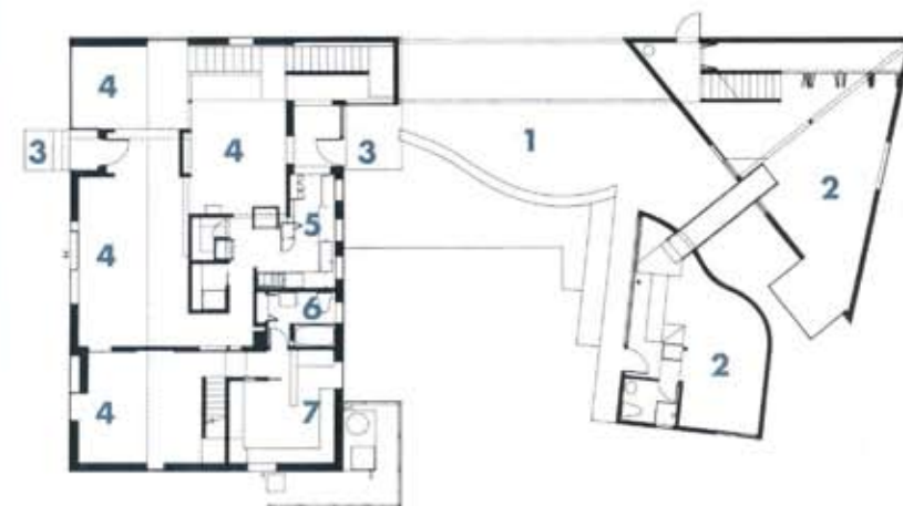
pianta del piano terreno/ground-floor plan